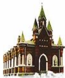
Церковь Свв. Апп. Петра и Павла