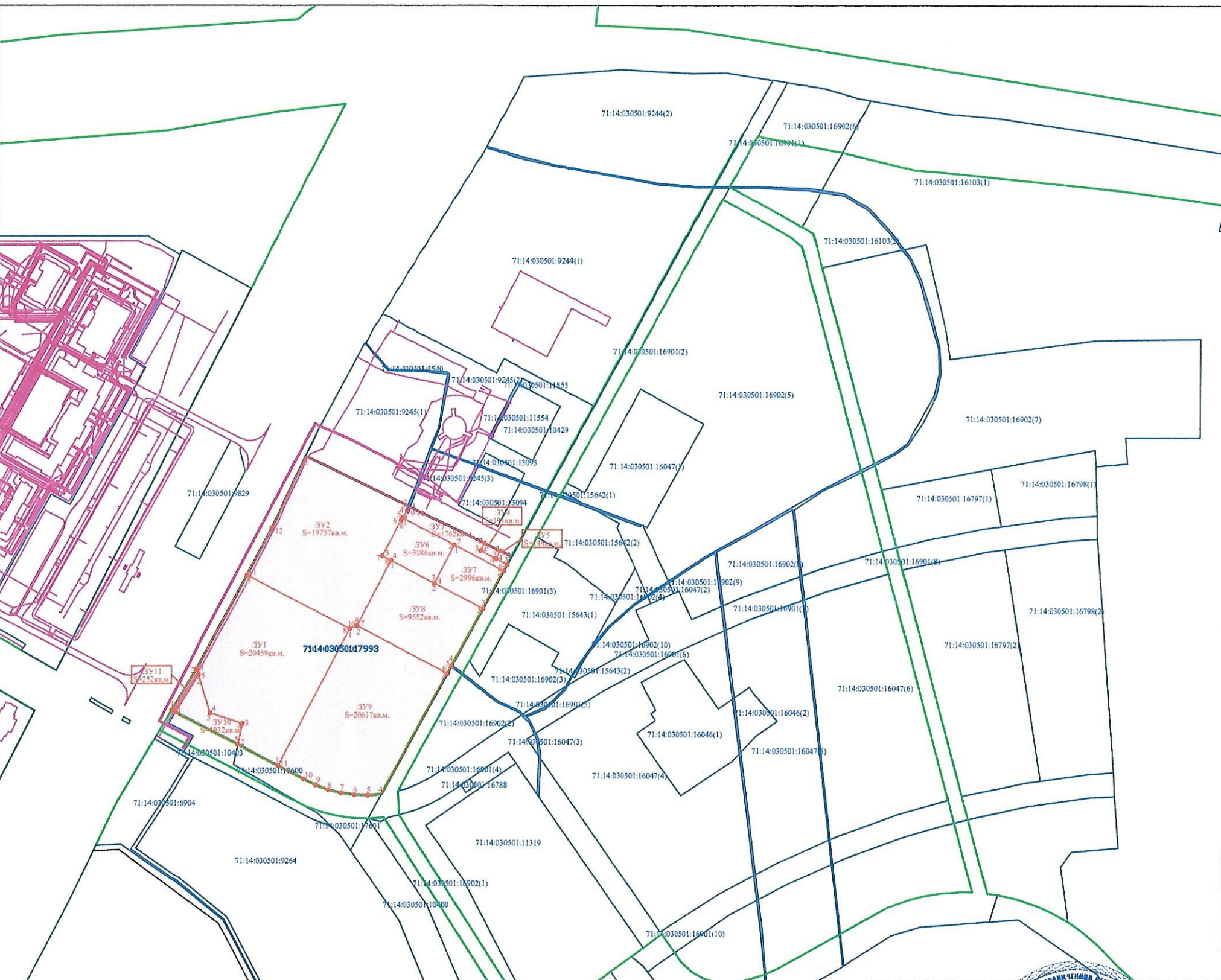
Сведения о формируемых земельных участках