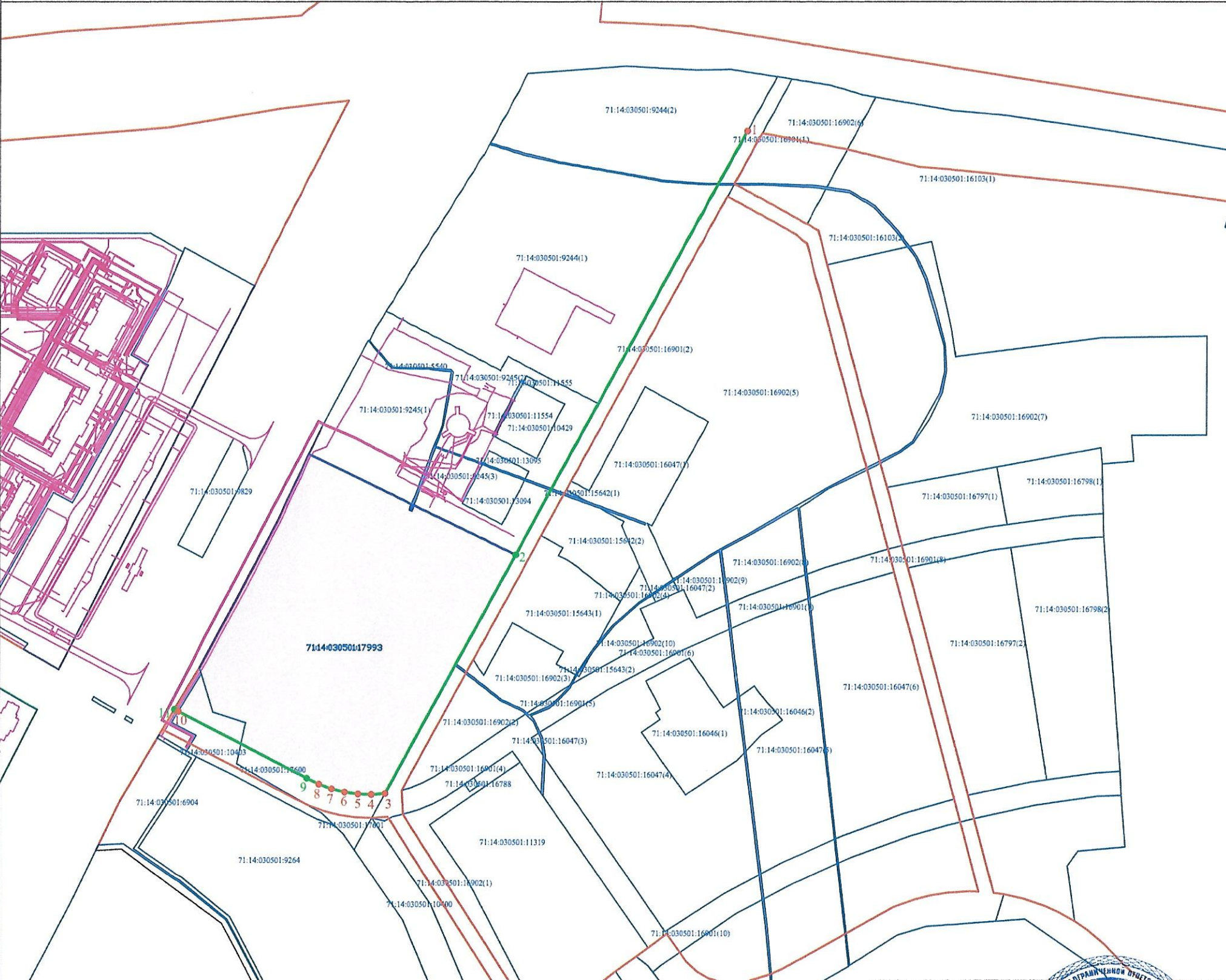
Ведомости координат поворотных точек проектируемой красной линии